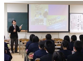
大学の先生による本校での模擬講義(商・国)