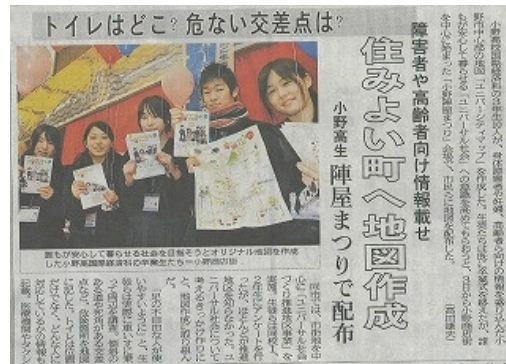
神戸新聞朝刊 平成24年3月4日より(国際経済科)