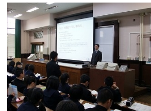
大学経営学部での講義体験(商業)

私立大学 慶応大学 早稲田大学 国際基督教大学 明治学院大学 立教大学 多摩美術大学 中央大学 同志社大学 立命館大学 近畿大学 関西大学 関西学院大学 甲南大学 龍谷大学 京都産業大学 神戸学院大学 神戸親和女子大学 武庫川女子大学