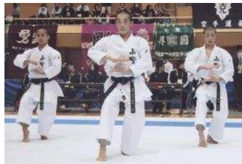
男子団体形 全国大会出場