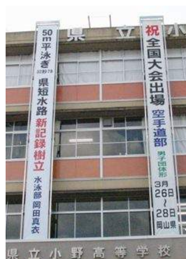
県立小野高等学校