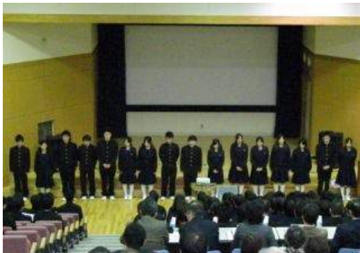
スタッフの皆さん