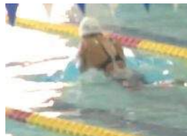
ジャパンオープン 2012 出場